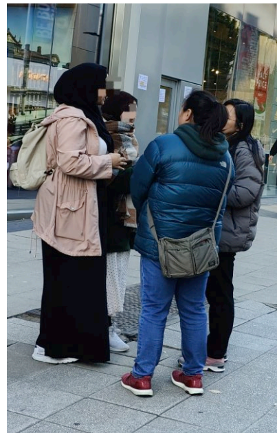
兩位一組，在市中心接觸穆斯林

註: 很感謝你閱讀我的通訊。我期望收到你的消息和為你禱告。請給我回音 ( judyhowc@gmail.com )。