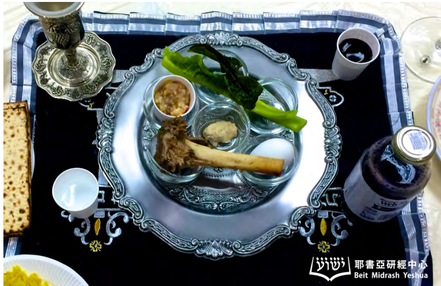
逾越節筵席碟子上的六種食物