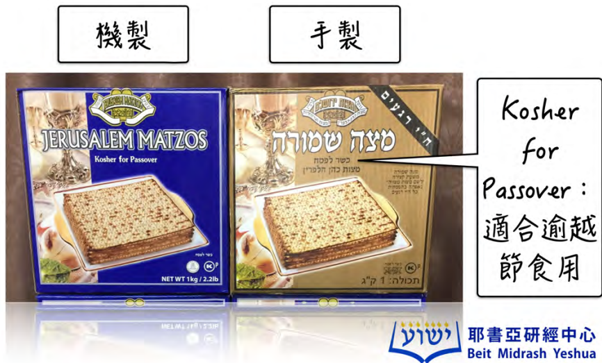
無酵餅一般有機製和手製兩種，圖中每盒大約有30塊。