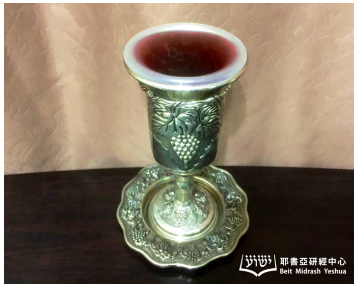
斟滿了葡萄酒的杯

耶書亞使每一個信靠他的人都分別為聖，蒙主悅納，並有自由去敬拜和事奉上帝 16 。